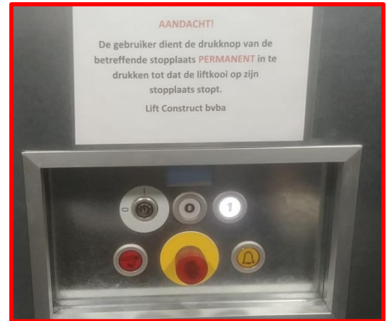
Drukknoppenpaneel in liftkooi